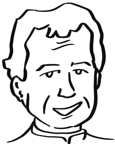
聖若望鮑思高神父